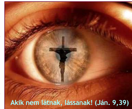
Akik nem látnak, lássanak! (Ján. 9,39)

ÜDVÖSSÉG – Mivel Isten senkit nem üdvözíthet akarata ellenére, van-e értelme annak, hogy olyanokért imádkozunk, akik tudatosan elutasítják Jézust? Igen. Igen! IGEN! De még mennyire! A legtöbb elveszett hitetlen ember, aki szándékosan még nem fogadta el Jézust élete Urának, azt gondolja, hogy a saját szabad akaratából hozta ezt a döntést, pedig nem így van. Isten Igéje azt mondja, hogy a sátán vakította meg őket. (2Kor. 4,4) Megakadályozza, hogy felismerjék az igazságot. Ezért van az, hogy ezek az emberek nem szabad akaratukból hoztak döntést.