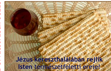
Jézus kereszthalálában rejlik Isten természetfeletti ereje!

Amikor megbecsülöd ezeket a drága igazságokat, amelyek a mi Urunk testével kapcsolatosak, akkor méltó módon részesedsz az Úrvacsorából. És akkor nem leszel se erőtlensé, se beteg és nem halsz meg idő előtt. (1Kor. 11,27-30) Nem! Hanem erős leszel és egészséges, és hosszú lesz a földi életed. Forrás: Joseph Prince