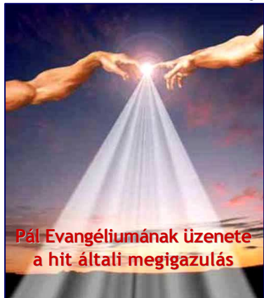
Pál Evangéliumának üzenete a hit általi megigazulás

„Minekutána azért most megigazultunk az Ő [Jézus] vére által...” – Róma 5,9