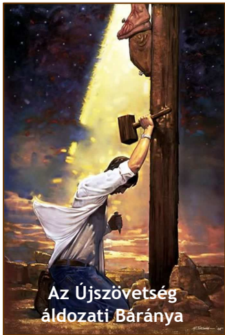
Az Újszövetség áldozati Báránya

● Jakab 5,16. Valljátok meg [ismerjétek el] bűneiteket egymásnak és imádkozzatok egymásért, hogy meggyógyuljatok: mert igen hasznos az igaznak buzgóságos könyörgése.