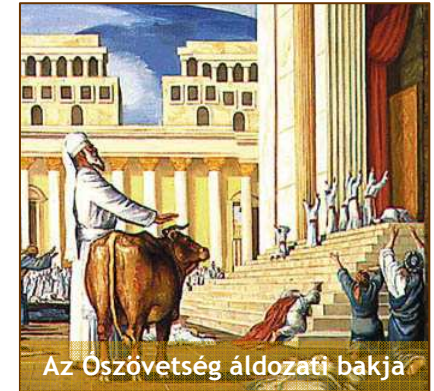
Az Ószövetség áldozati bakja

A tisztítás szó itt sem múlt idő, hanem egy folymat . A görögben a megvallani szó azt is jelenti, hogy elismerni . Egyrészt el kell ismernünk, ha elvé tettük , ha rosszat tettünk. Másrészt el kell ismernünk azt is, hogy Jézus mit tett értünk a kereszten, amikor az Ő szent vérével eltörölte a bűnt, és igazzá tett bennünket Isten előtt. A „megbocsátatott” szó egy befejezett igeidő . (1Ján. 2,12) Fontos tudni, hogy János levele Pál evangéliuma után 50 évre íródott. S ha ezeket a verseket a szövegkörnyezetében tanulmányozzuk, akkor megértjük a valódi üzenetét. Figyelembe kell venni azt is, hogy ki mondja, mit mond, és kinek szól. Az 1János 1. fejezete a gnosztikus zsidóknak íródott , és nem az újjászületett keresztényeknek. Jézus keresztre feszítése előtt a nem üdvözült zsidók vallották meg a bűneiket, de akkor sem tételesen . (Mát. 3,6. Luk. 15,21.) Ha az Ószövetségben egy izraelita elkövetett valamit, mit kellett tennie az Írások szerint? Egy bakot kellett vinnie a pap elé, hogy mutassa be a bűnért való áldozatot. Kellet-e neki bűnvallást tennie? Nem! Mit vizsgált a pap? Nem az ember vétkére tekintett, hanem az áldozati bárány tökéletességére . Mit jelent ez az Újszövetségre vetítve? Ha valaki piszkálódna, vagy ha azzal jönne az ördög, hogy bűnös vagy, akkor küldd el őt, hogy vizsgálja meg a mi áldozati Bárányunkat, Jézust, ahogy ez az Ószövetségben is volt. A mi Bárányunk pedig hibátlan!