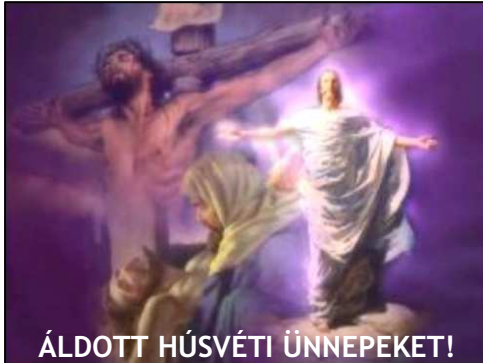
ÁLDOTT HÚSVÉTI ÜNNEPEKET!

„A Páska-ünnepre való előkészület napja volt, és utána különleges szombati ünnepnap következett. (EFO) / ... minthogy előkészületi nap volt...” (P. Soós István) — Ján. 19,31.