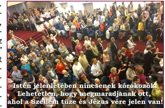
Isten jelenlétében nincsenek kórokozók! Lehetetlen, hogy megmaradjanak ott, ahol a Szellem tüze és Jézus vére jelen van!