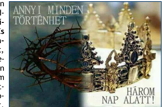
ANNYI MINDEN TÖRTÉNHEZ

HELYETTESÍTŐNK — Jézus azért szenvedett, hogy kifizesse helyettünk a megváltás árát, és mi kiszabaduljunk az átok alól. Ő elhordozta, elviselte a pokol súlyos terhét, az összes betegséget és fájdalmat. Jézus halott szelleme ment le a pokolba három napra, hogy ne nekünk kelljen. Tehát nagyon sok ponton láthatjuk a helyettesítő munka lényegét. Felvállalta mindazt, amiért elveszettként nekünk kellett volna a pokolba lemennünk. Megváltott a bűnöktől és a háromszoros átoktól, a betegségtől, a szegénységtől és a szellemi haláltól. Jézus legyőzte az ősi ellenséget, az ördögöt. A Kolosse 2,15 szerint Jézus minden támadó eszközétől megfosztotta az ellenséget! — bf —