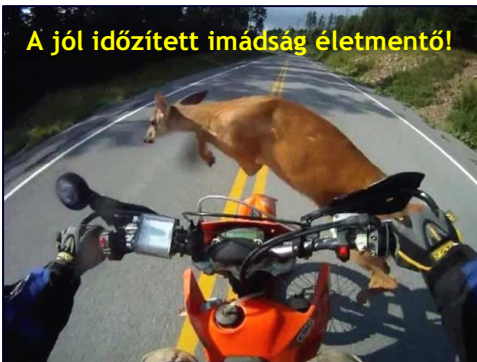
A jól időzített imádság életmentő!

„Ne engedd [Atyám], hogy kísértésekkel próbára tegyenek bennünket, és szabadíts meg minket a gonosztól!” – Máté 6,13. Egyszerű fordítás