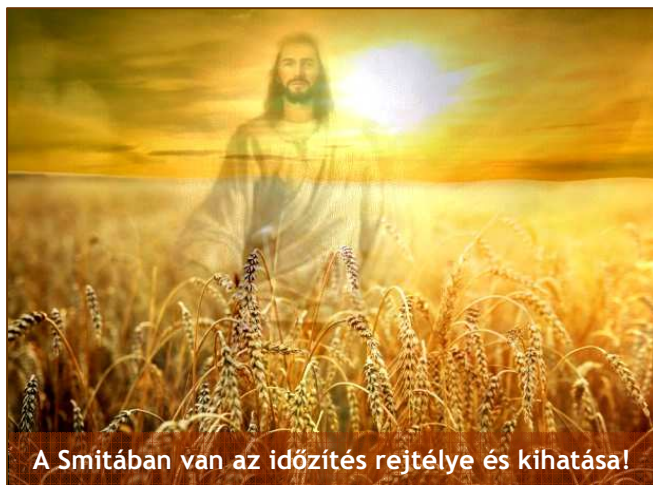
A Smitában van az időzítés rejtélye és kihatása!

„Hat esztendeig vesd be a te földedet és takard be annak termését. A hetedikben pedig pihentesd azt... Ekképpen cselekedjél szőlőddel és olajfáddal is.” – 2Mózes 23,10-11