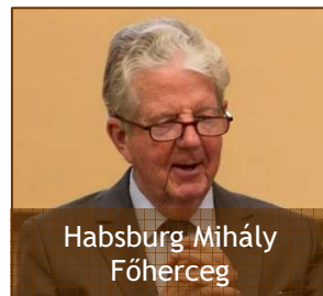
Habsburg Mihály Főherceg

NAGYÁGYÚ – Az Ige a létünk mértékadó eleme, az életünk meghatározója, ami az igei megvallások szintjére képes emelni bennünket. Ha az életünk bármelyik területén javítani szeretnénk, akkor az igei megvallásokat kell mind gyakrabban megtenni, és az életünk szintje fel fog oda emelkedni . Leszögezhetjük, hogy a hitünk rendszeres megvallása egy igazi nagyágyú! Ahogy a Zsidó levél 4,14 verse írja, mindig ugyanazt kell kimondanunk, soha nem eltérve a hittől, mert így tudunk abban a győzelemben járni, amit Krisztus megszerzett a számunkra a kereszten. -bf-