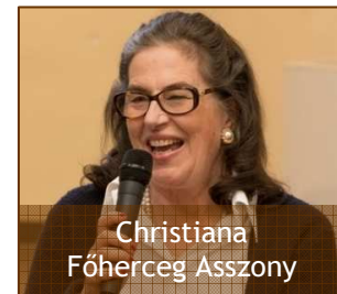
Christiana Főherceg Asszony

(A Németországban élő K. J. magyar énekesnőt még szántódi alpolgármesterként ismertem meg egy évtizede. Ez a bizonyúság felkérésre készült, miután elhangzott a szántódi gyülekezetben. – Szerk.)