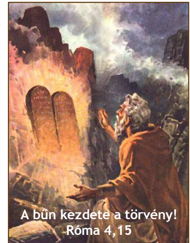
A bűn kezdete a törvény! Róma 4,15

Ne a kritizálás szándékával menj gyülekezetbe, hanem azért, hogy átvedd az Úr üzenetét és épülj általa!